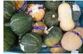
えびすなんきん他

ぶどう（一房）は、キャンベラ・デラウエアが200円、ピオーネ450円、藤稔560円、オーロラブラック750円など。カボチャ（二個）は、坊ちゃんなんきん90円、会津かぼちゃ120円、えびすなんきん180円など。