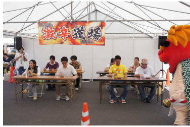
真剣な顔の参加者

九月のみつの里の店内には、美味しいぶどうやカボチャがところ狭しと並んでいます。中でも、カボチャは外国産とちがいが、生産者の方が愛情を込めた大小色とりどりの品が並んでいます。甘く、ほくほくとした秋の味覚をお試し下さい。